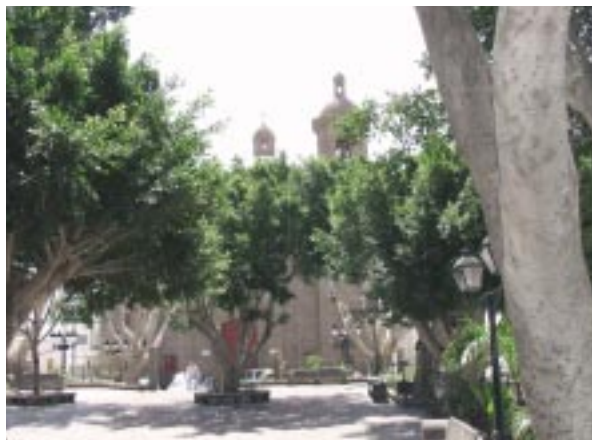
Casco Histórico. Plaza del Rosario.