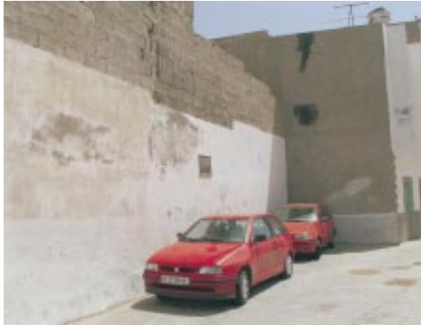
Casco Histórico. Plazoleta de Galdós. Previo