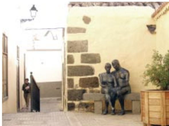
Casco Histórico. Callejón de los Enamorados.

te, la agricultura tradicional. El Casco Histórico de Agüimes veía así cómo se perdía su principal fuente de recursos. Por ello, el Ayuntamiento decidió indagar en las nuevas posibilidades de revitalización y diversificación económicas, dirigiendo sus esfuerzos a la revalorización de sus recursos ociosos.