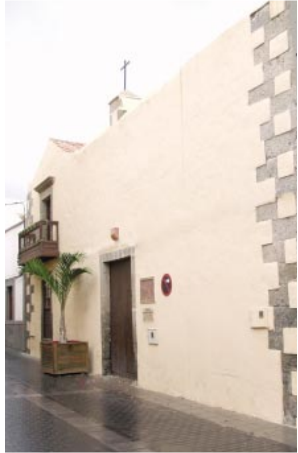
Centro de la Mujer

nueva situación. Además de reforzar aquellas normas propias de un espacio protegido como lo es el Casco Histórico como Bien de Interés Cultural, fueron aprobadas nuevas normas como las que exigen el uso de unos colores determinados para el enlucido de las fachadas, y está actualmente en vías de regulación el tráfico rodado en la zona, que va a adquirir un carácter peatonal sensiblemente mayor al actual.