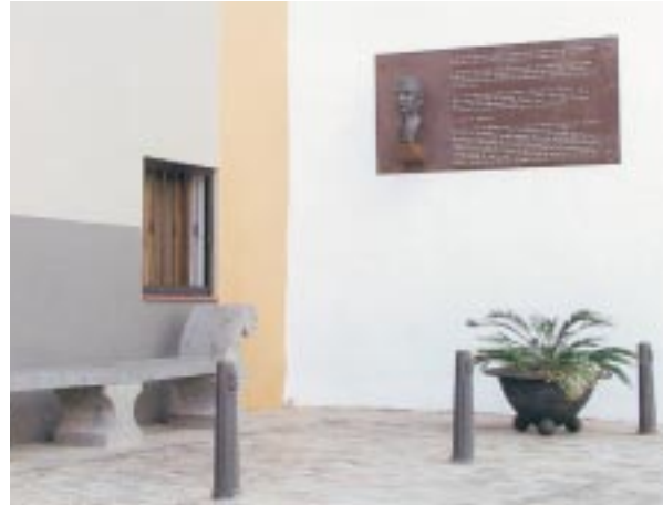
Casco Histórico. Plazoleta de Galdós. Estado Actual